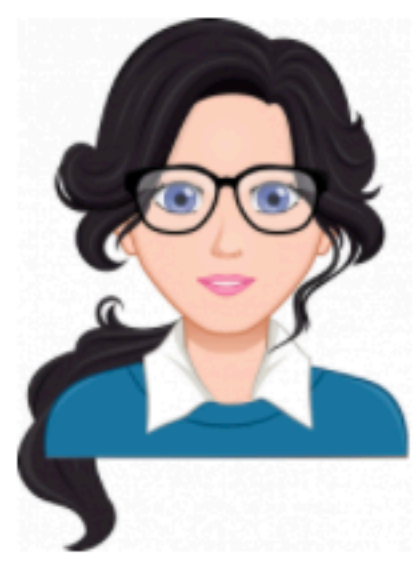
H. [redacted] (VP4)

De eerstvolgende zorgverlener die u zal bezoeken is: